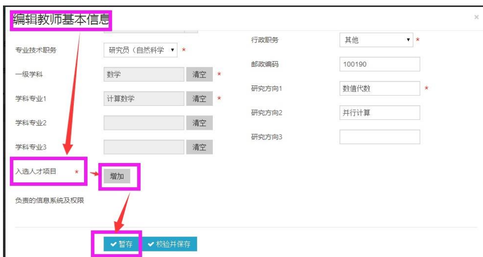
图 2. 导师入选人才项目及入选年份操作界面